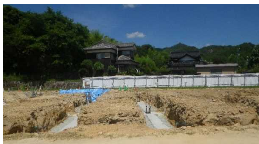
基礎工事の様子 7月末

新公民館は段差のないバリアフリー（和室は例外）、トイレも洋式。ただし、上下足は履き替えの方向。