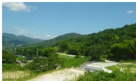
真尾川に架かる橋建設途中